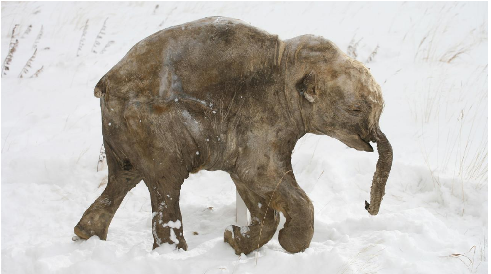
Mammuthus primigenius fraasi Dietrich – mamut – a jégbe fagyott Ljuba mamutbébi