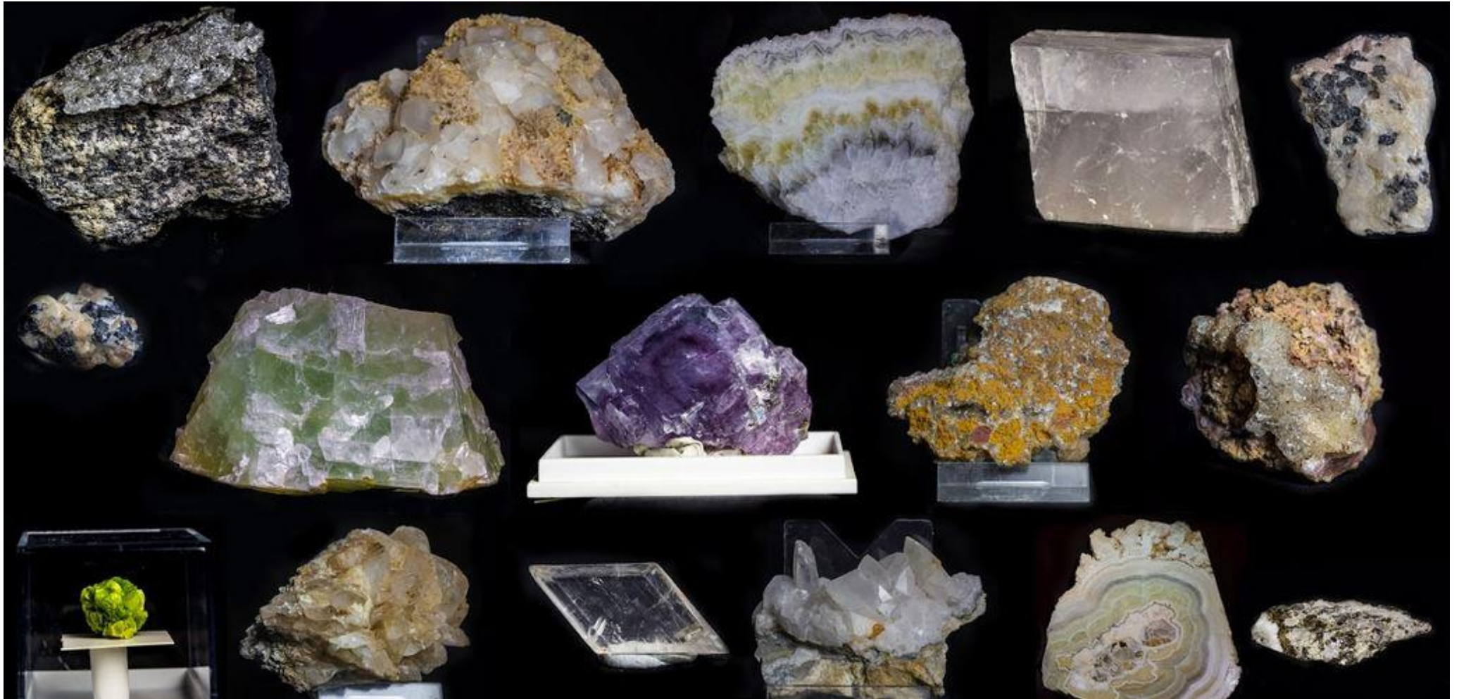
Lumineszkáló ásványok - természetes fényben